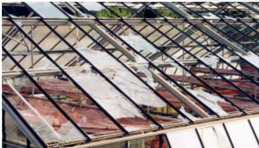
Bild 6 | Gewächshaus nach einem Hagelereignis. Der vollflächige Ersatz der Scheiben ist notwendig.

Die Grenze zwischen einem beschädigten und einem unbeschädigten Bauteil wird als Schadenkriterium bezeichnet. Da bei mehreren Funktionen die Schadenkriterien verschieden sein können, kann ein Bauteil verschiedene Hagelwiderstände aufweisen. Beispielsweise kann die Beschichtung einer Fassade bereits bei relativ kleiner Hagelwirkung beschädigt werden. Die Fassade erfüllt jedoch nach wie vor das Prüfkriterium Wasserdichtheit. ▶