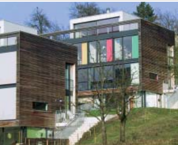
Bild 4 | Doppelfamilienhaus erbaut 2004. Massiver Sichtbetonsockel, horizontale Bretterverkleidung, Lärche unbehandelt, Holzfenster mit Stoffstoren, Attikageschoss mit Metallverkleidung