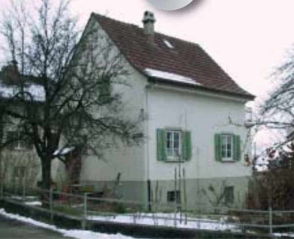
Bild 3 | Einfamilienhaus erbaut ca. 1935. Massives, verputztes Mauerwerk, Holzfenster (mit Vorfenster), Holzfensterläden, Steildach mit Ziegeleindeckung (Pfannenziegel)