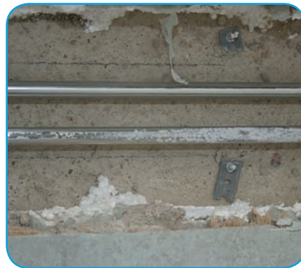
Bild 10 | Freigelegter Heizkörperanschluss mit der eingedrungenen Ausgleichsmasse bis zum abweigenden T-Stück. Die dunklen Bereiche in der hellgrauen Masse sind korrodierte Stellen.

nicht geeignet ist, Feuchtigkeit von den Rohren fernzuhalten. Bei fachgerechter Erstellung des Bodenkanals hätte das aus der gebrochenen Verbindung der Trinkwasserleitung ausströmende Wasser trotz fehlender Wärmedämmung die Heizungsrohre nicht von außen angreifen können, da es schadenfrei abgefließen wäre. Die unsachgemäße Ausführung des Bodenkanals liegt nicht im Verantwortungsbereich des Sanitärinstallateurs, sondern